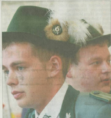
Schützenhut mit Feder: Eines der ersten Uniformteile, die ein neues Mitglied erhält. Die Federn werden an einer Refhellrossette mit einem Motiv aus dem Schützenbereich befestigt.